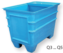
Q3 ... Q5